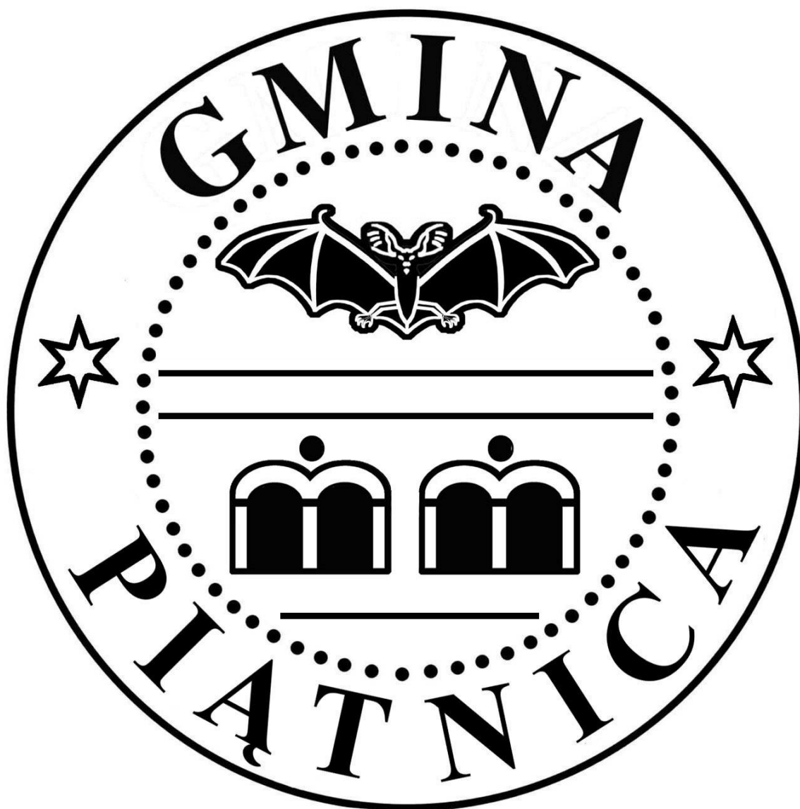
Pieczęć Gminy Piątnica

Załącznik Nr 3 do uchwały Nr 17/V/2011 Rady Gminy Piątnica z dnia 30 stycznia 2011 r.